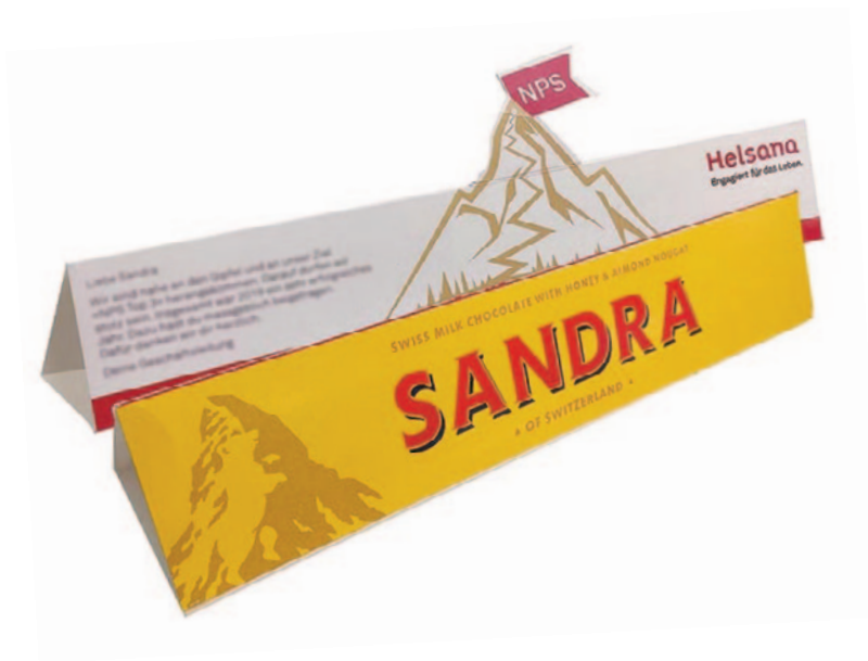
Toblerone personalisiert mit individuellem Design.